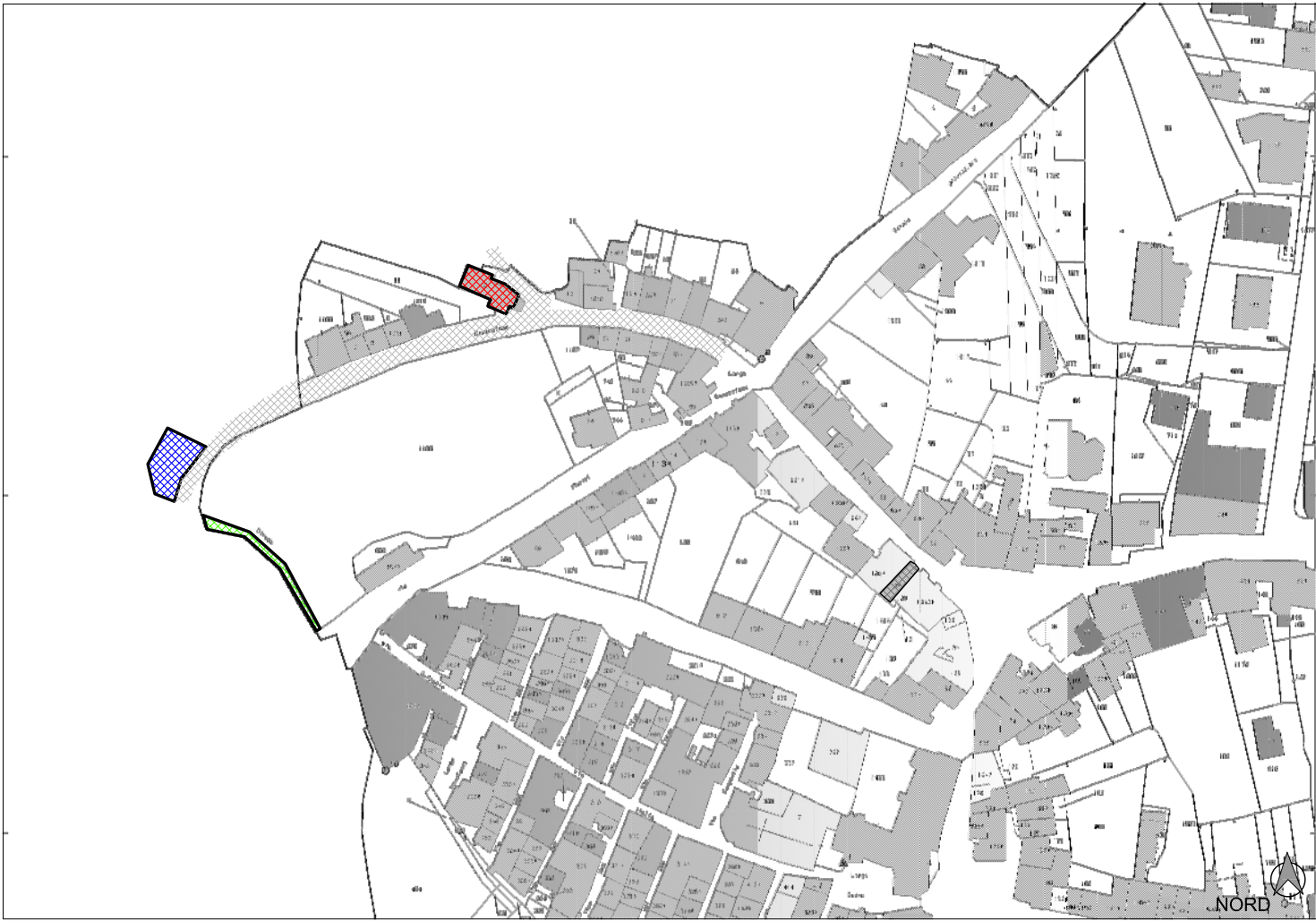
Cartografia Catastale - foglio 10 - scala 1:2.000