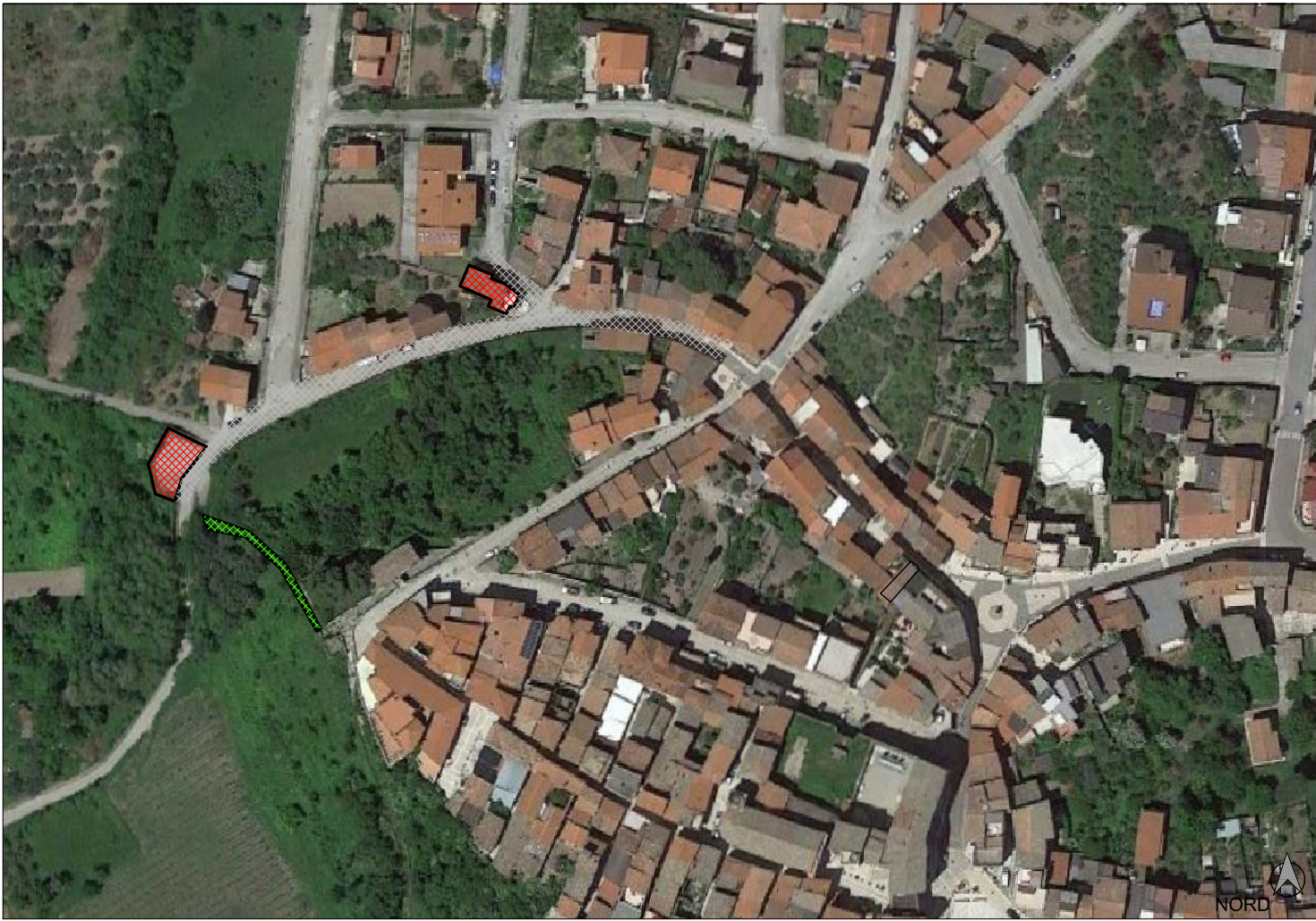
Ortofoto Satellitare - scala 1:2.000